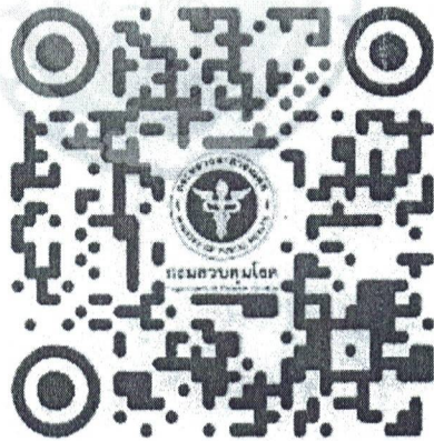
QR code ลงนามปฏิญาณตน